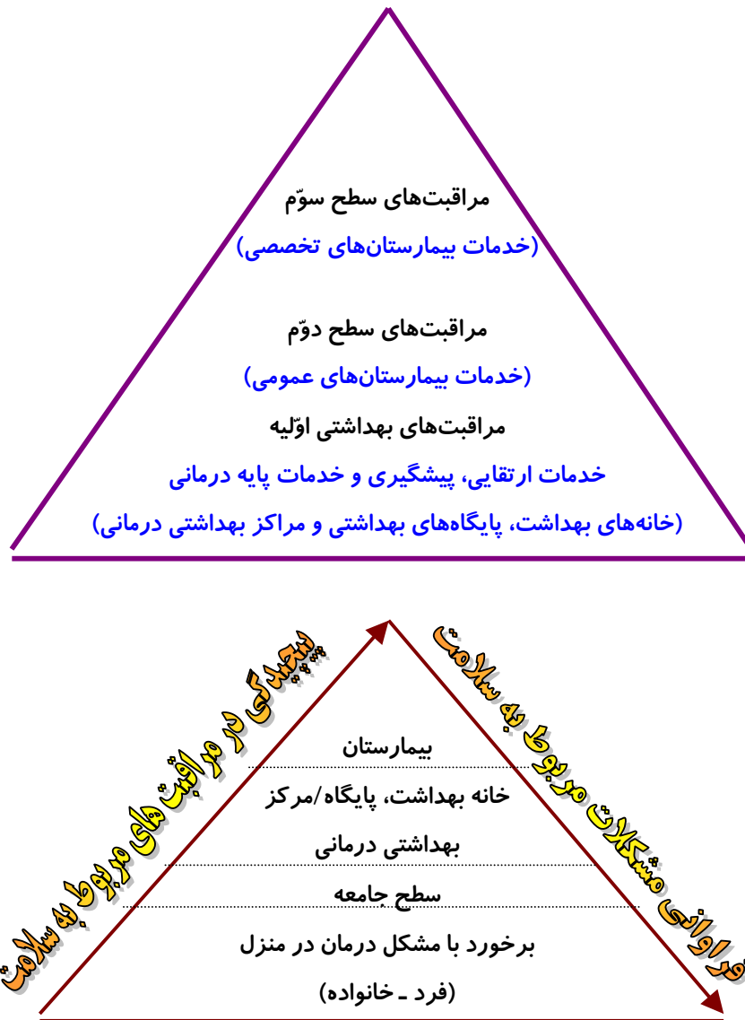
شکل ۱ - سطوح مراقبت‌های بهداشتی

مردم به سهولت قابل دسترسی باشد. از طرفی مراقبت‌های بهداشتی اولیه براساس این واقعیت است که بسیاری از مشکلات مربوط به سلامتی جمع‌گشایی از مردم به سطوح پائین هرم PHC (مطابق با شکل ۱) اختصاص می‌یابد.